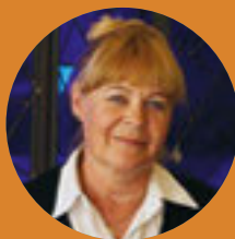
INGIBJÖRG STEINUNN SVERRISDÓTTIR Nationell bibliotekarie, Island