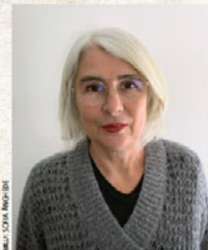
MIJL SÖRIM AWG-IDE