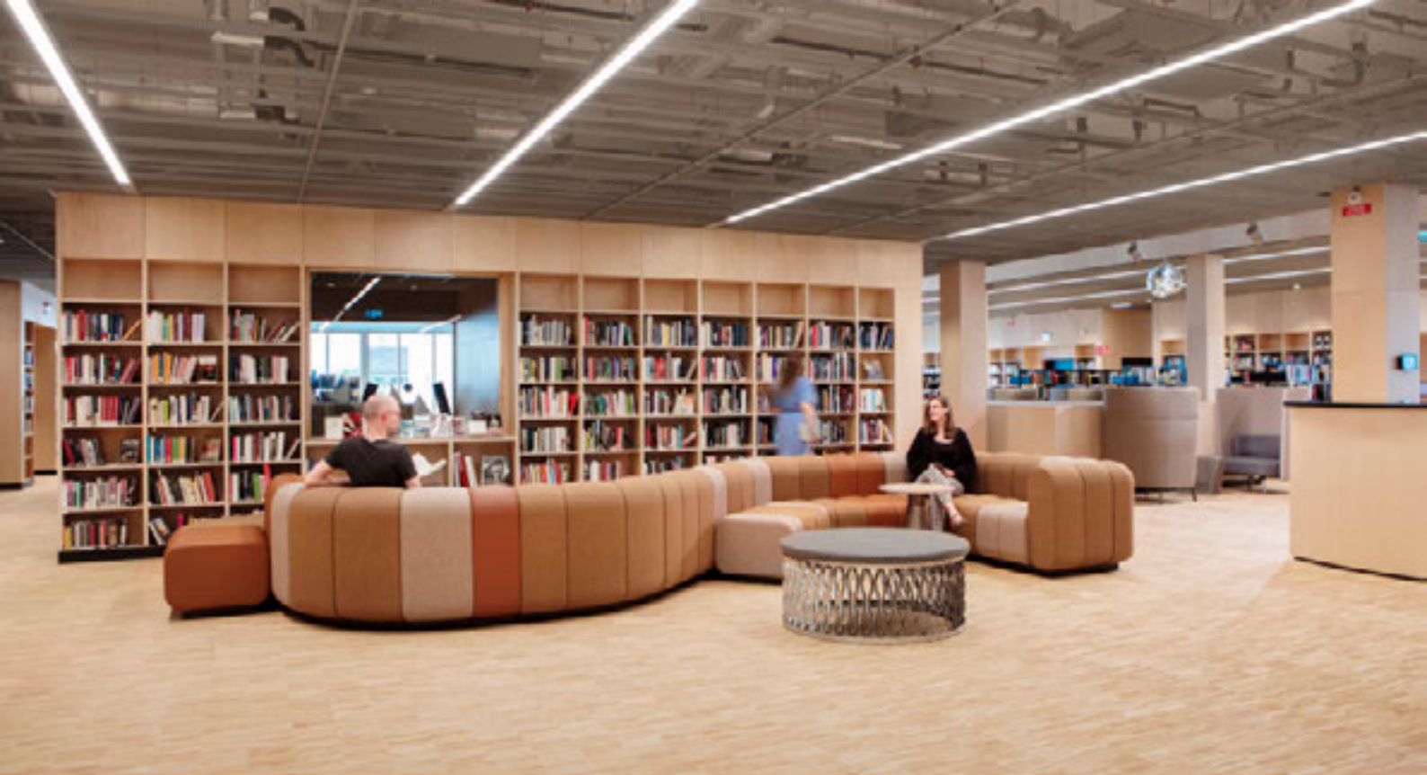
OVAN: ÖRFERRO STADSBIBLIOTEK. NEDAN: STOCKHOLMS STADSBIBLIOTEK.