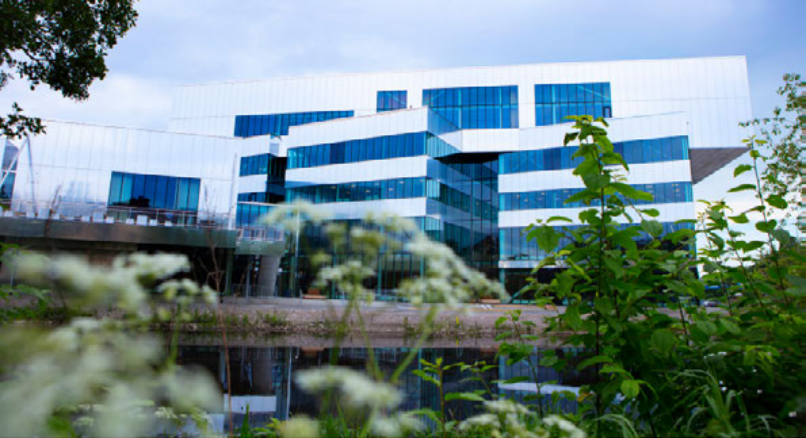
OVAN: ÖREBRO STADSIBLIOTEK. BILD: KARIN FORBERG. NEDAN: STOCKHOLMS STADSIBLIOTEK. BILD: ANDREAS NUR.