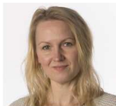
OMIT OMAJ : OTI

Hemma, på mitt rum, har jag ett eget bibliotek. Mina böcker är placerade på hyllor i bokstavsordning på författarens efternamn som följs av flikar i olika färger. Om jag har fler böcker av en författare eller om det finns en serie av böcker, står dom uppradade från vänster till höger och varje bokrygg har en liten vit klisterlapp med en bokstavskombination på typ två till tre bokstäver som till exempel: Buh, Blä, Bra eller vε som är förkortning för Vet Ej.