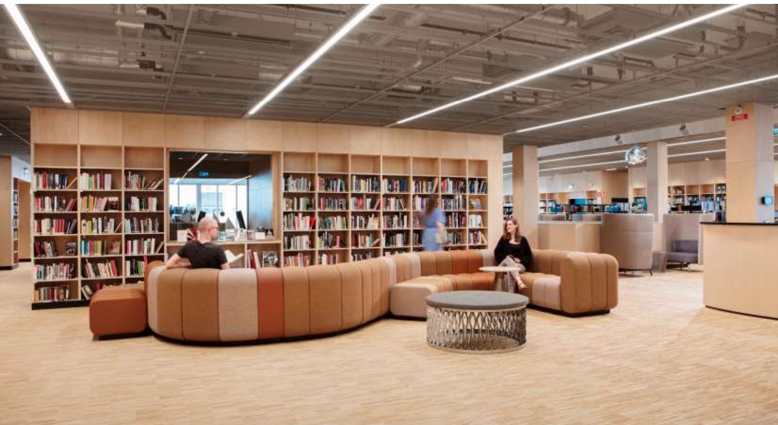
OVAN: ÖREBRO STADSBIOTEK. BILD: KARIN FOBERG. NEDAN: STOCKHOLMS STADSBIOTEK. BILD: ANDREAS NUR.