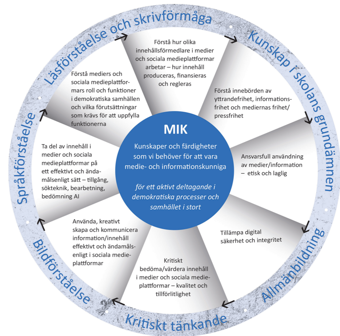
Figur 2. MIK: Kunskaper och färdigheter, individnivå (Carlsson 2023)

MIK befinner sig i en process där förändringar oavbrutet pågår i samhället, teknologin och medierna. Det är ett begrepp i rörelse globalt, i Europa, nationellt, regionalt och lokalt. Det finns dock en rad element i MIK-begreppet som består över tid även om teknologikutvecklingen kräver vissa modifikationer.