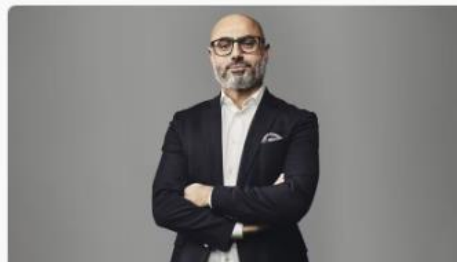
Haval van Drumpt