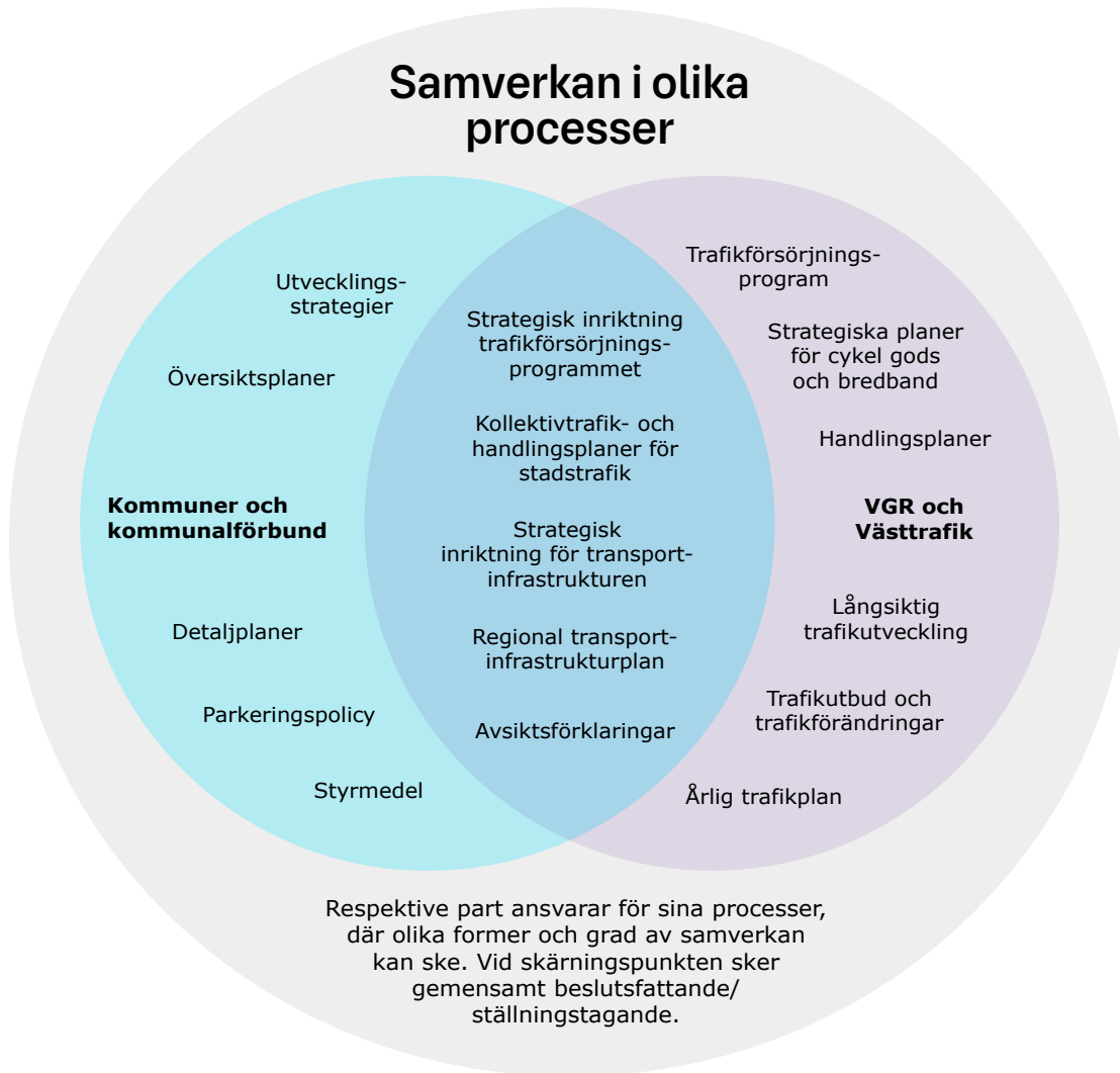
Figur 1: Samverkan i olika processer med bäring på kollektivtrafik och samhällsplanering. Respektive part ansvarar för sina processer, där olika former av samverkan kan ske. Vid skärningspunkten sker gemensamt beslutsfattande/ ställningstagande.

För kollektivtrafiken ställer sig beredningen för hållbar utveckling bakom trafikförsörjningsprogrammets strategiska inriktning. Den strategiska inriktningen lägger grunden för innehållet i trafikförsörjningsprogrammet, vilket styr hur Västtrafik kan verkställa trafik. På lokal nivå kan VGR/Västtrafik och kommunerna besluta om handlingsplaner och avsiktsförklaringar för att kraftsamla kring utvecklingen inom ett specifikt geografiskt område.