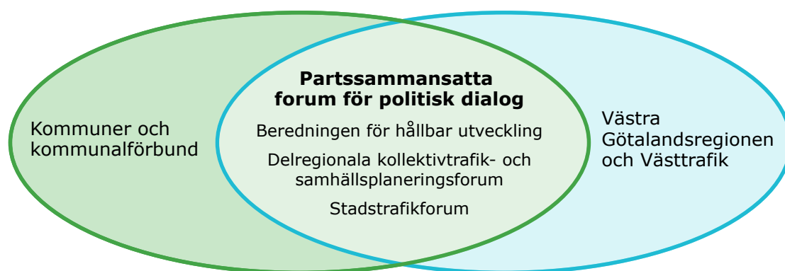
Figur 3: Parternas forum för politisk dialog om kollektivtrafik.

Som forum för politisk dialog om kollektivtrafikutvecklingen i Västra Götaland finns beredningen för hållbar utveckling (BHU) och fyra delregionala kollektivtrafik och samhällsplaneringsforum. För de fem regionala kärnorna; Borås, GMP (Göteborg/Mölndal/Partille), Uddevalla, Trollhättan/ Vänernsborg respektive Skövde sker fördjupad samverkan inom respektive stadstrafikforum.