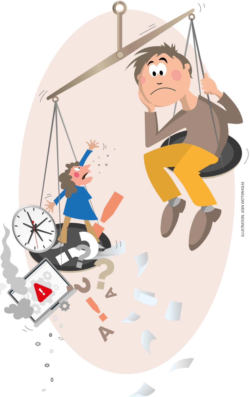
ILLUSTRATION: JOEN WETTERHOLM

Grunden för ett framgångsrikt förändringsarbete läggs med kunskap och en gemensam begreppsapparat. Det menar psykologen och docenten Mats Eklöf som har arbetat och forskat om psykosocial arbetsmiljö i över 30 år.