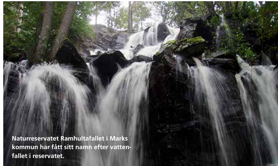
Naturresevatet Ramhultafallet i Marks kommun har fått sitt namn efter vattenfallet i resevatet.