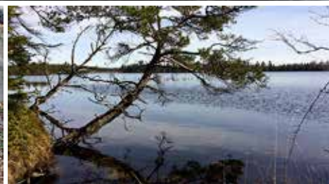
Komosse ligger sydost om Ulricehamn. Här finns en cirka fyra kilometer lång slinga som ger känslan av att man är längre norrut i Sverige.

hela landet. Den innehåller alltifrån sjukhus, rehabcentrum och tandläkare till museer, slott, lekplatser och campingar.