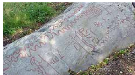
Tisselskog Högsbyn är ett naturresevat och hållristningsområde i Bengtsfors kommun.