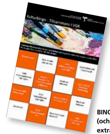
BINGO. Utmana dig själv (och kompisen) med lite extra kulturhändelser.

– Första aktiviteten ut är vår KulturBingo där man genom bingobrickan uppmantras att prova på en rad olika kulturinriktade aktiviteter. Man kan välja aktiviteter från VGR:s kulturutbud eller