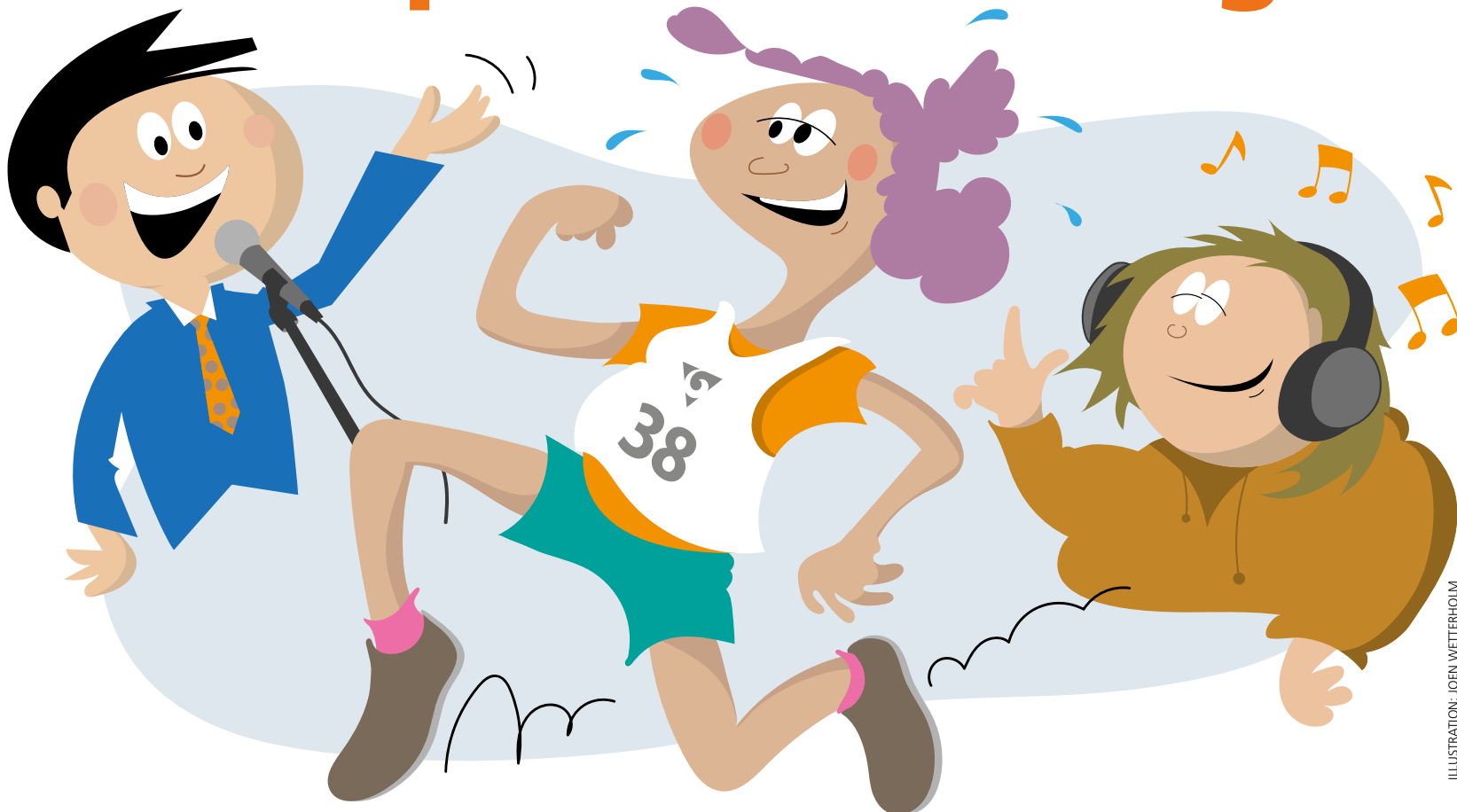
ILLUSTRATION: JOEN WETTERHOLM

ÅSA AXELSSON arbetar främst med VGR Tour, Regionklassikern, Cykelutmaningen och VGR Balans. Åsa gläds alldeles extra åt att VGR Tour är "som vanligt" igen: