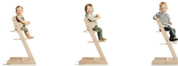
Stolen justeras när barnet växer

Viktigt att man ser över sittandet var 3:e månad för att se om det behöver justeras.