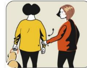
Pendla med armen