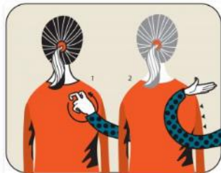
Sök trappa ner