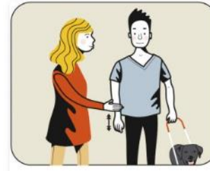
Korrigerar hunden, alternativ 2