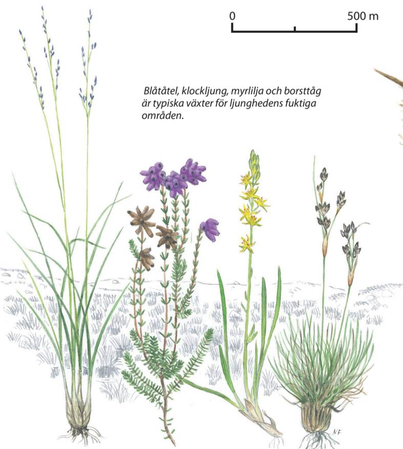
Blåtåtel, klockklung, myrlija och borsttåg är typiska växter för ljunghedens fuktiga områden.