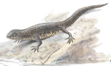
större vattensalamander (hona)