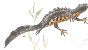
större vattensalamander (hane)

I Änggårdsbergen återfinns alla Sveriges ormarter, koppar- och skogsödla samt mindre och större vattensalamander. Två av dessa, hasselnoken och större vattensalamander, är skyddade enligt EU:s art- och habitatdirektiv.