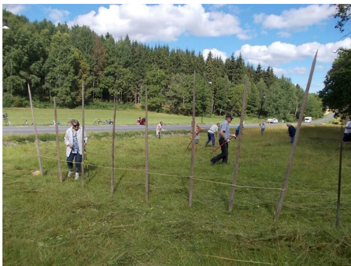
Bild 5 Linhässjan klar. Observera solfjäderformen på störarna.

Stånghjässorna var vanligast i mina hemtrakter, norra Ångermanland men vi använde även linhässjor. De kräver inte så mycket virke och man kan enkelt bära virket till en hel hässja. Störarna bör vara 2,2 – 2,5 m och gjorda av undertyckt gran eller stavagran. Gran som växer väldigt tätt, så tätt att det knappast blir några grenar och årsringarna är mycket täta. Rotändan bör vara 5 – 6 cm och toppändan ca 3 cm i diameter. Spetsa dem i båda ändarna så kan de också användas som krake/vålm eller volm.