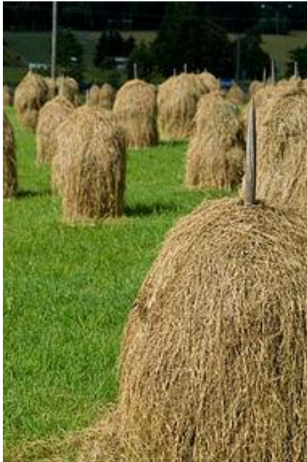
Bild 6 Volme, såte, krake

Samma störar som finns i lindhässjan kan användas för att volma hö. En stör med ”stopp” spettas ner i marken och höbuntar träs över den spetsade toppen.