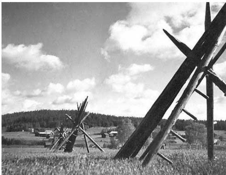
Bild 4 Hässjevirket uppställt efter slåttern.

När höet hade tagits in ställde man upp hässjevirket på detta sätt. Man korsar två gubbar och lägger en troe i krysset. Lutar krysset lite åt det håll där man lägger troerna mot marken och travar allt virke i det V som bildas när gubbarna korsas.