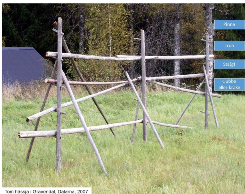
Bild 1 Tom stånghässja i Gravendal, Dalarna, 2007

Här är ett exempel från Anundsjö, Norra Ångermanland med 6 pinnar och lite kortare avstånd.