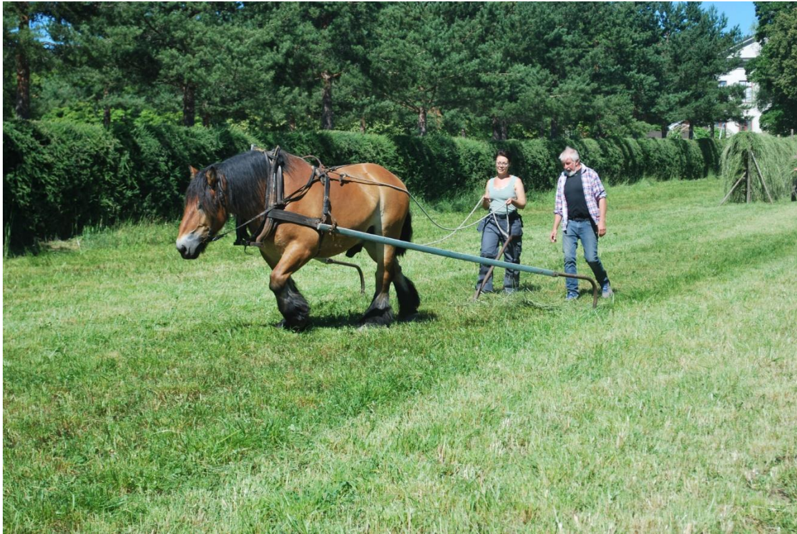
Slätter på gammal vis med stånghässja och där ardenneren Paroll drar släpräfsan (Bild från Slätterdag Wij trädgårdar 2018-07-04 anordnad av Naturskyddsföreningen Gävleborg och Dalarna)