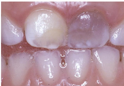
Färgförändring av mjölkttand

En blödning inne i tanden kan uppstå vid skadetillfället. Denna kan efter en tid orsaka en färgförändring som i vissa fall kan vara övergående. Som vårdnadshavare ska du kontakta tandvården om tanden mörknar eller orsakar besvär