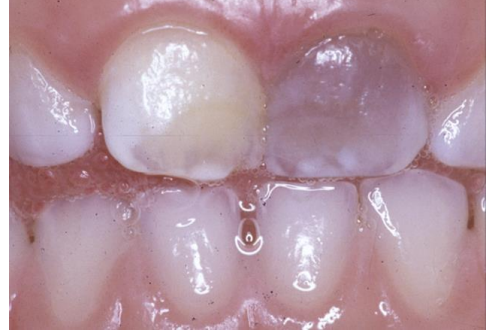
تغيّر اللون في السن اللبني

قد ينشأ نزف داخل السن عند الإصابة. وقد يتسبب ذلك بتغيّر اللون مع مرور الوقت، وقد يزول في بعض الحالات. يجب عليك بوصفك ولي أمر الطفل أن تتصل بعيادة رعاية الأسنان إذا أصبح لون السن غامقاً أو تسبب بمتاعب للطفل.