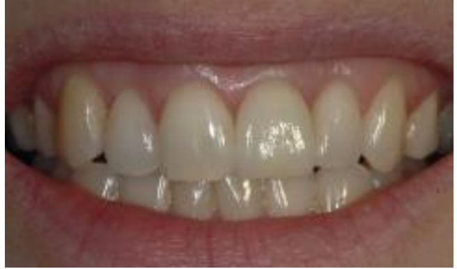
تاج السن الجديد أصبح الآن في مكانه.