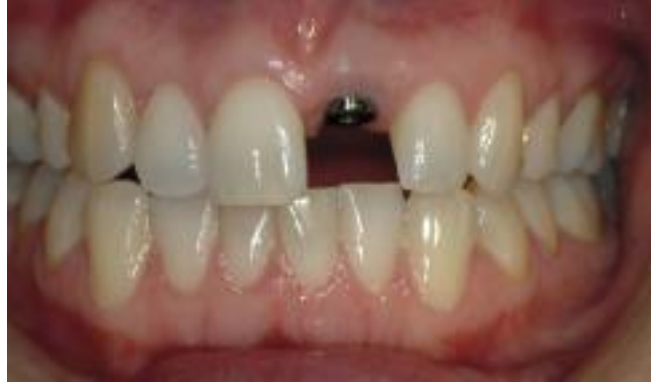
البرغي المزروع جاهز لتثبيت تاج السن الجديد.

إما أن يتم فتل السن إلى البرغي أو أن يتم تثبيته بالملاط (إسمنت).