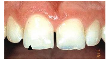
حافة المينا تصبح رقيقة