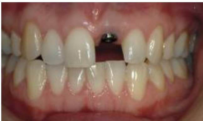
Implantatet redo för den nya tandkronan.

Tanden skruvas eller cementeras fast på implantatet.