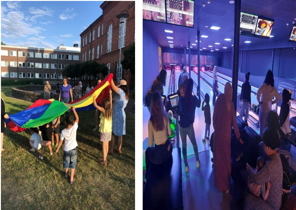
Rörelse och utomhusaktiviteter