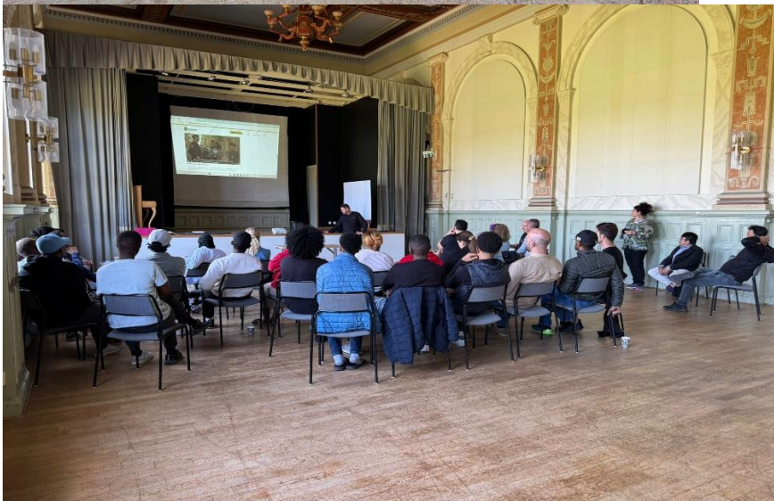
Infotbildning/ besök från Polisen