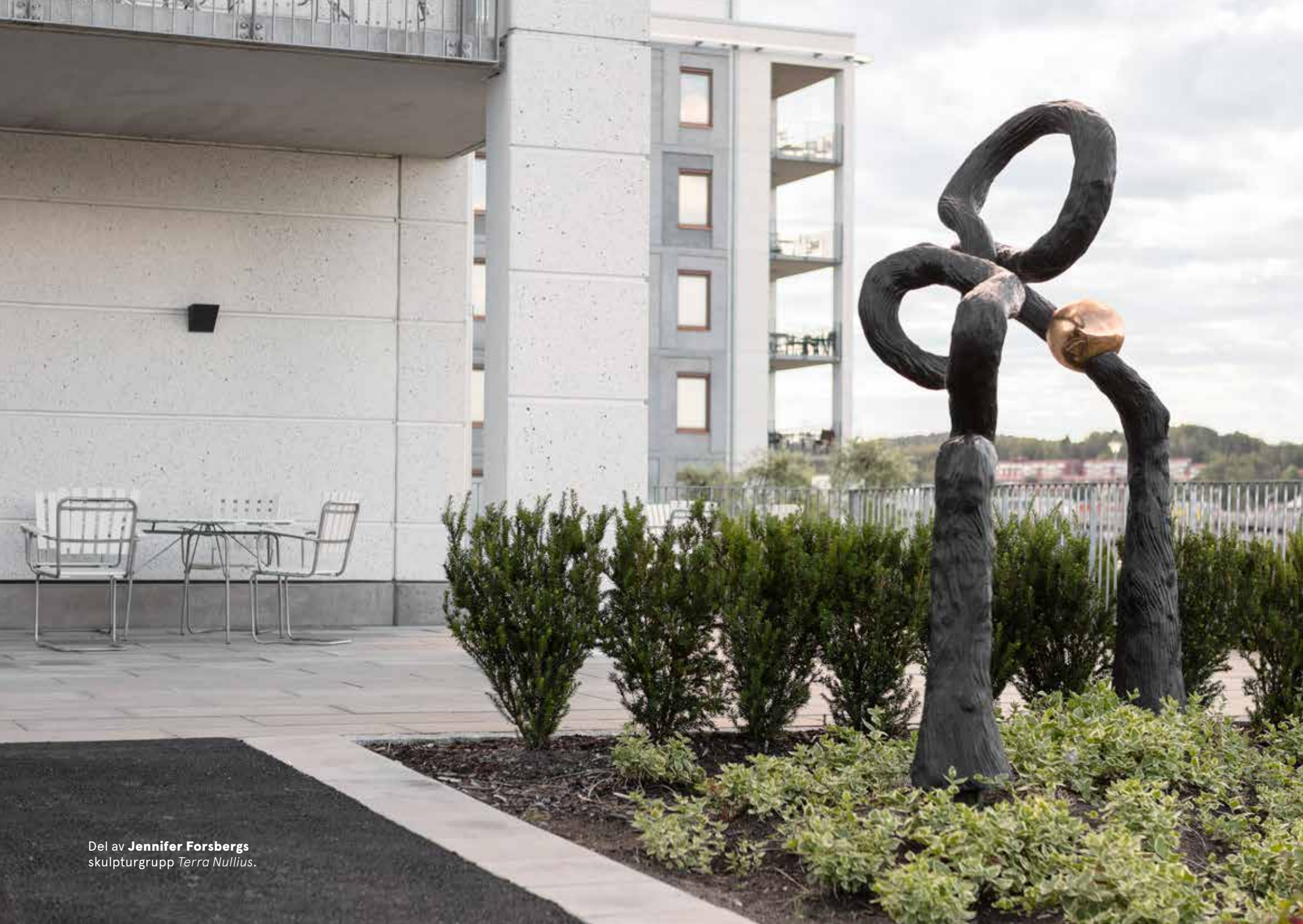
Del av Jennifer Forsbergs skulpturgrupp Terra Nullius .