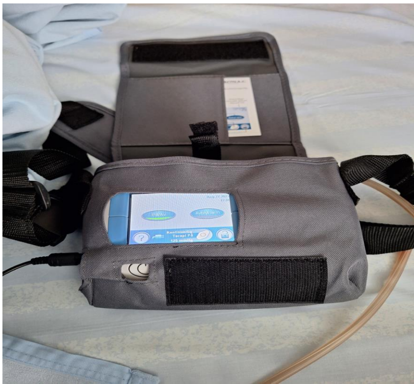
ActiVAC med väska.